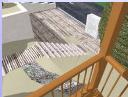
Blick von der Terrasse auf die Außentreppe