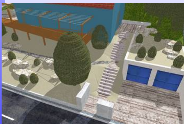
Blick vom Grundstück auf der gegenüberliegenden Straßenseite

Der Hausgarten wurde geplant von: Dipl. Ing. (FH) Ralph Schäffner Landschaftsarchitekt BDLA / SRL