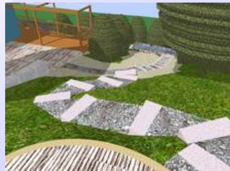
Blick von der oberen Gartenterrasse